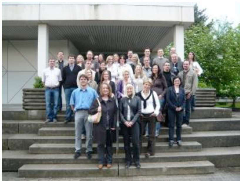
Der Jahrgang 1994 wählt für sein Erinnerungsfoto die klassische Variante vor dem Schulhaus.