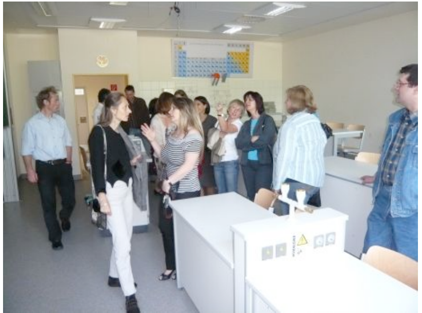
Der Abiturjahrgang 1984 besichtigt die neuen Chemiesäle und zeigt sich beeindruckt.