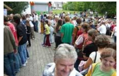
... einem großen Bierzelt -