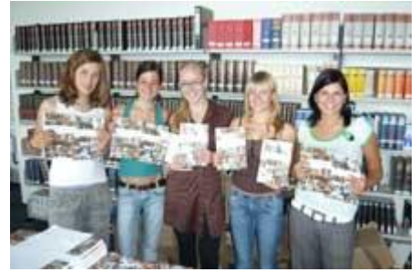
In der Bibliothek zählt währenddessen die 11d die Jahresberichte ab.