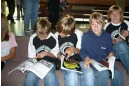
... und werden eifrig gelesen.