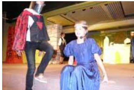
die Schauspieler in glänzender Spiellaune