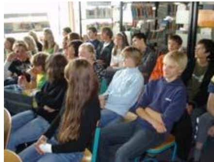
Schüler und ...