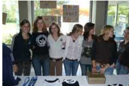
Der Fanartikel-Shop des Gymnasiums Wertingen