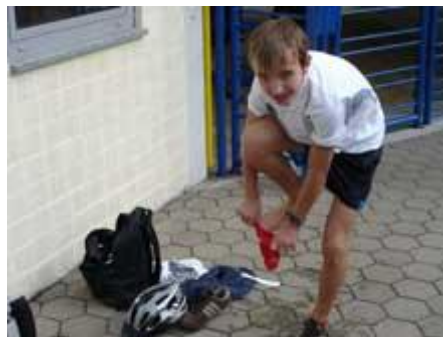
schnell umziehen ...,