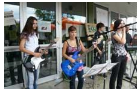
„No Secrets“ vor dem Haupteingang.