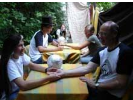
... Freunde lesen aus der Hand.