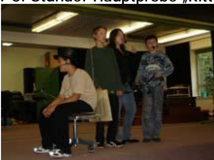
Stimmen die Abläufe?

1.-6. Stunde: Hauptprobe „Ritter Rost macht Urlaub“