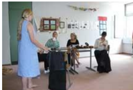
mit dem armen Mädchen, das so böse Schwestern hat,