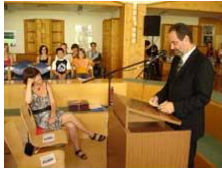
DANKE des Schulleiter und ...