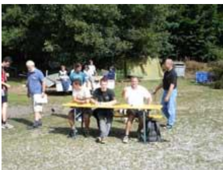
Die Wettkampfleitung erwartet die Triathleten

Allen Teilnehmern ein großes Kompliment für die sportliche Leistung, den Organisatoren herzlichen Dank für die viele Arbeit.