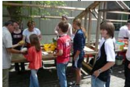
Essen auf die Hand macht wenig Müll.