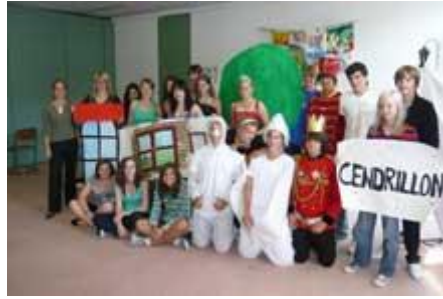
dann spielen sie noch heute.