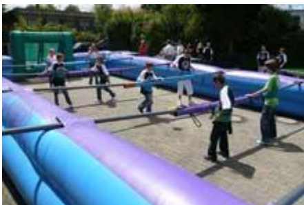
Kicker im kleinen Pausenhof ...