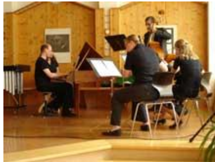
das Kammermusikensemble des Lehrerkollegiums.