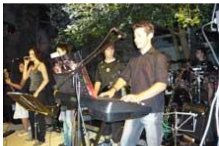
bevor „No Secrets“ das Heft in die...