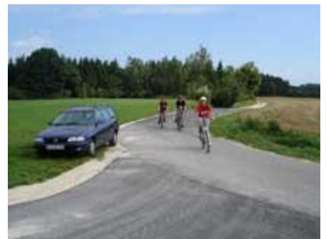
Rad fahren ...,