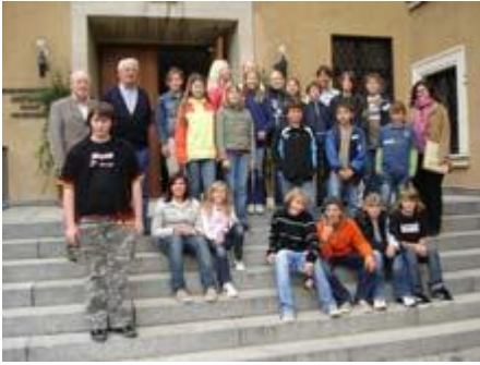
Das obligatorische Gruppenfoto