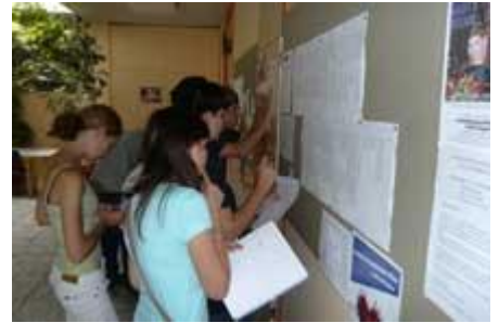
und für die neue K 12 hängt der Stundenplan aus, der eifrig studiert wird.