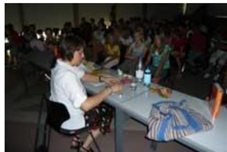
Das Auditorium ist fasziniert

Um 19.00 Uhr trifft sich das Laptop-Team zur letzten Sitzung des Jahres. Aus gegebenem Anlass wählt man die Form eines „Arbeitsessens“ bei dem der Geschichtslehrer des Teams aus der Runde verabschiedet wird.