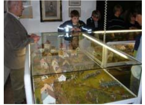
Die Schlacht um Wertingen