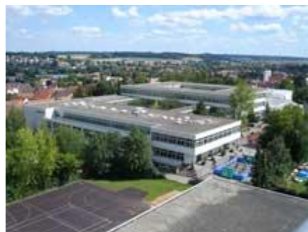
Die Feuerwehr gewährt einmalige Blicke über Wertingen und Umgebung.