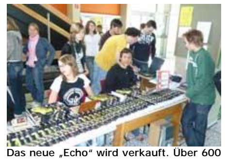
Das neue „Echo“ wird verkauft. Über 600 Exemplare gehen über den Tisch ...