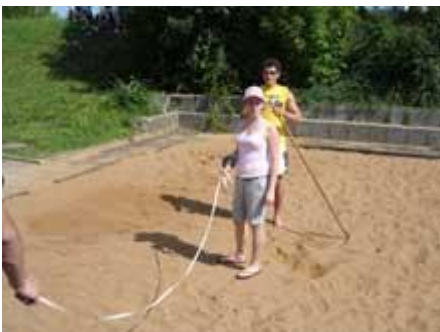
Die „Großen“ helfen beim Messen ...

Am Vormittag finden bei schönem Wetter die Bundesjugendspiele der 5.-7. Klassen statt.