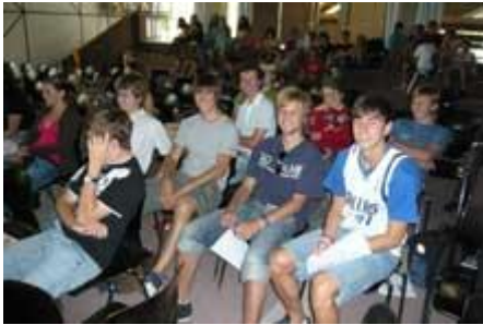
Die 11a veranstaltet