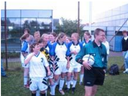
Letzte Vorbereitung ...