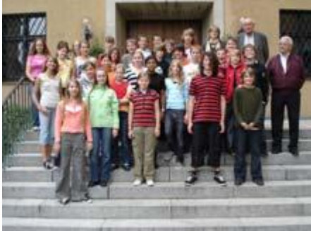
Gruppenfoto vor dem Schloss