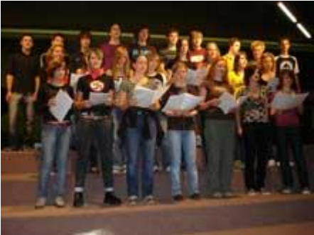
Die 10d singt Elton John