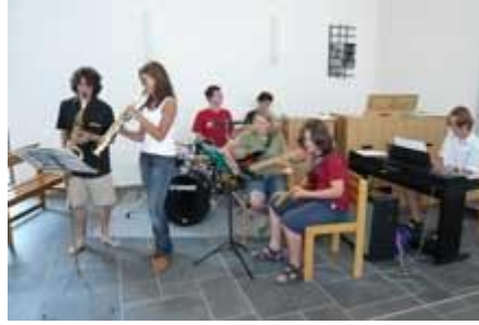
mit einer kleinen Band