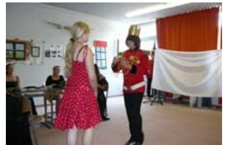
sondern nur ihr!