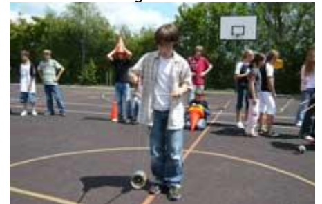
Akrobaten auf dem Hartplatz ...