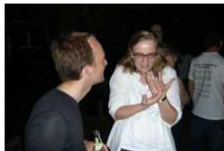
A propos „in die Hand nehmen“?