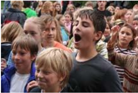
Die Schüler/innen haben ihren Spaß ...