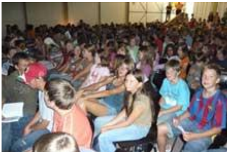
Das Forum ist proppenvoll ...

Und weil's so schön war, gibt es „Ritter Rost macht Urlaub“ in zwei Sondervorstellungen für die Unterstufe