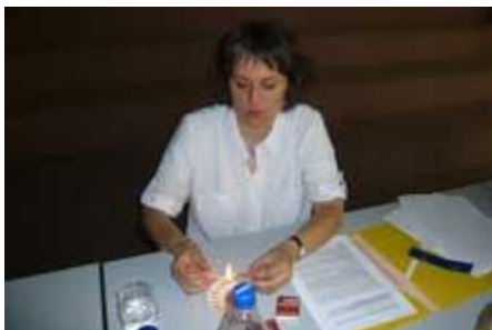
sorgt sie dabei selbst.