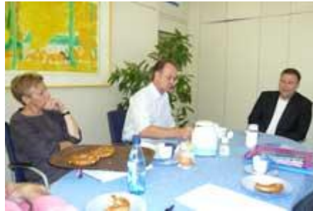
zunächst im Direktorat ...