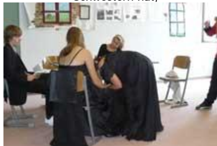
Der Schuh passt nicht den Schwestern, ...