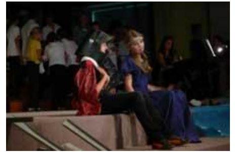
im Duett ...