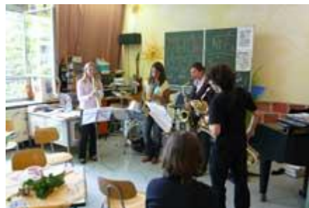
... und viel Musik: Saxophonquartett im Musik-Café ...