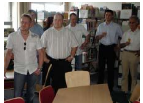
Sektempfang in der Bibliothek