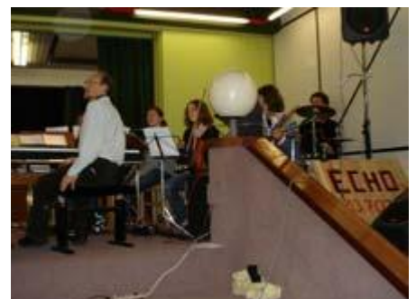
Auch die Band ist im Einsatz