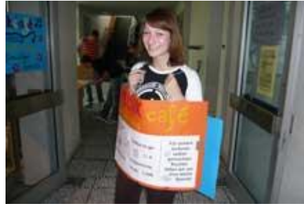
Falsche Sandwiches ...