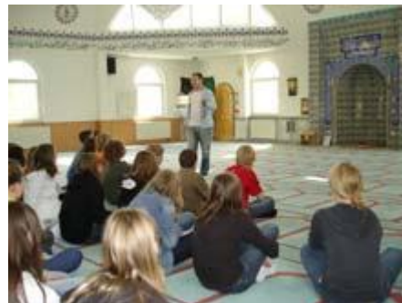
interessiert dem Vortrag zu.