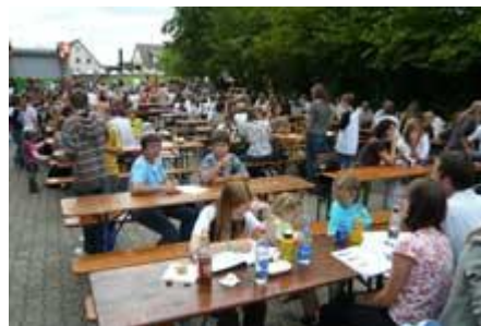
Der Pausenhof gleicht ...