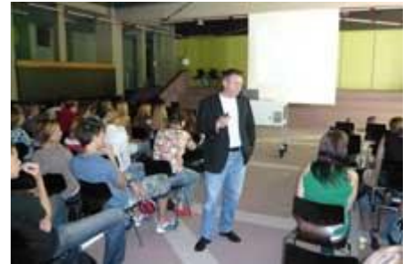
und dann im Forum.