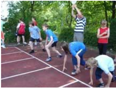
Die „Kleinen“ rennen, ...