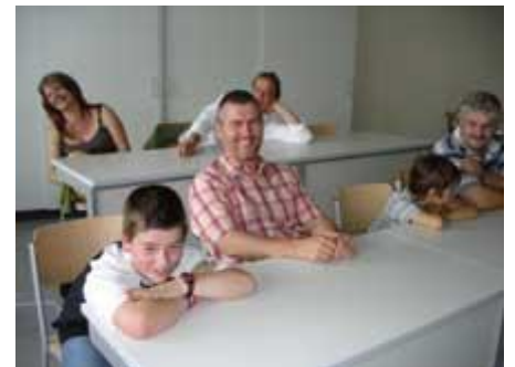
haben ihren Spaß im Chemietrakt.