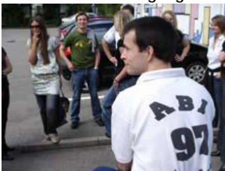
Treffen auf dem Parkplatz.

Treffen des Abi-Jahrgangs 1997 an der Schule.