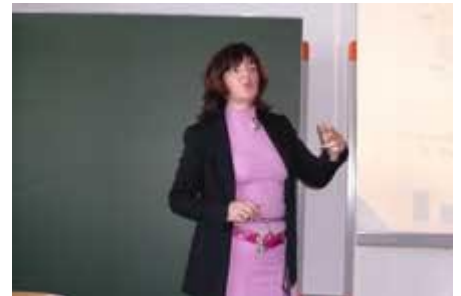
in voller Fahrt.

Von 13.30 – 17.00 Uhr beraten die Klassenkonferenzen Ergebnisse für die Jahreszeugnisse 2007. Um 19.00 Uhr gibt es im Forum eine weitere Aufführung von „Ritter Rost“; das Forum ist bis auf den letzten Platz gefüllt, am Ende erneut tosender Beifall für die Musical-Truppe.