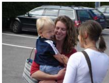
Auch der Nachwuchs darf mit.