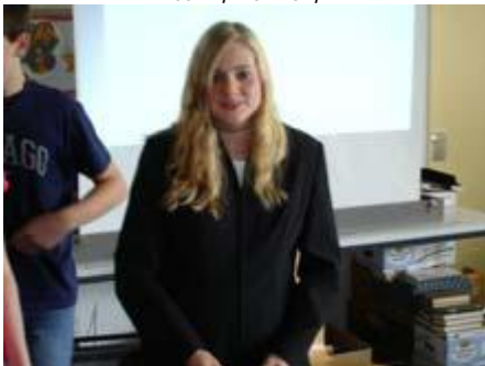
Da muss man schon etwas bieten: Outfit,