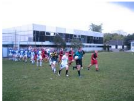
dann geht's los.