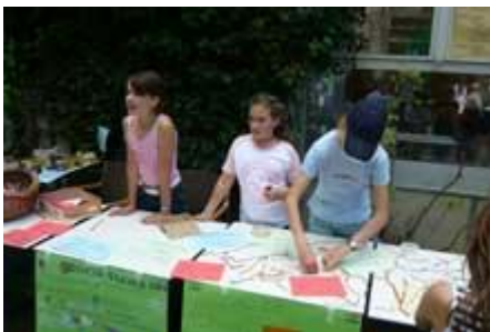
Schmuckwerkstatt im Innenhof ...