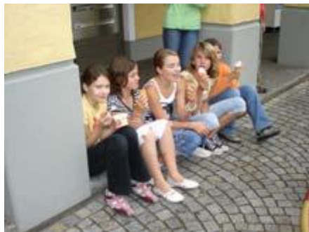
Danach noch „Eis im Regen“