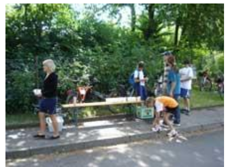
Für Verpflegung ist gesorgt.