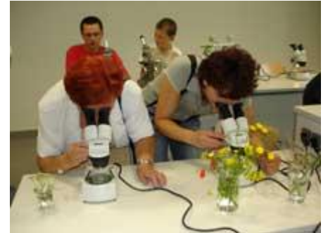
Faszinierende Einblicke in die Flora