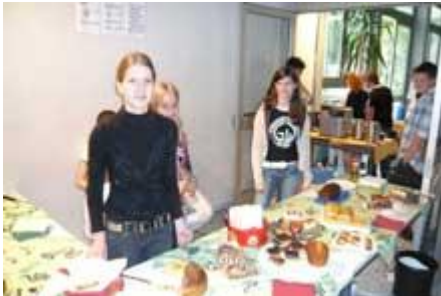
Bücherbasar der SLB