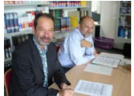
die jeweilige Fachjury: