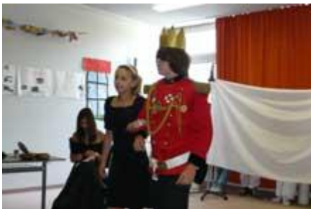
wo es den Prinzen kennen lernt.