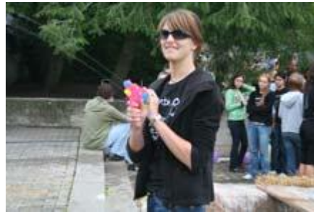
Abigentin im Einsatz