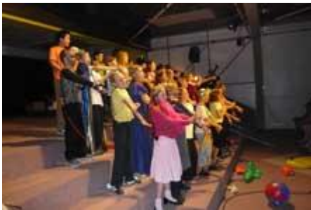
... und Tutti beim Schlusslied.