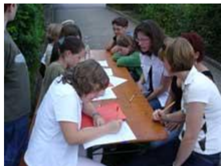
Das Wetter spielt prächtig mit