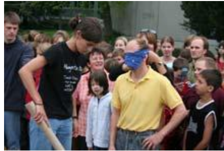
... die Lehrer auch.