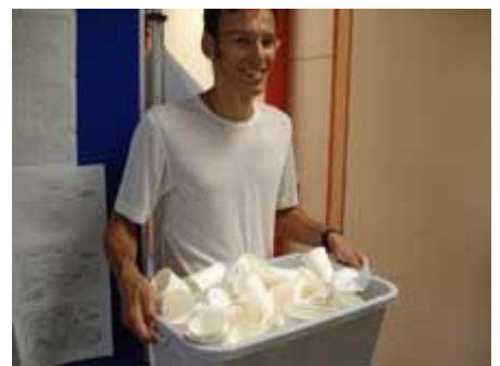
und der Initiator des Ganzen packt tatkräftig mit an.

Allen Teilnehmern ein großes Kompliment für die sportliche Leistung, den Organisatoren herzlichen Dank für die viele Arbeit.