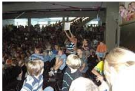
Und ab in die Ferien!

Um 10.30 Uhr beginnt die Jahresabschlusskonferenz, dann ist auch für die Lehrkräfte das Schuljahr 2006/07 beendet.