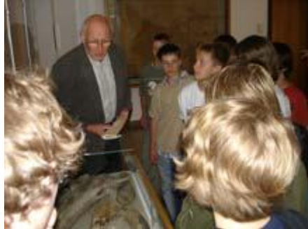
Die Mammutzähne ...