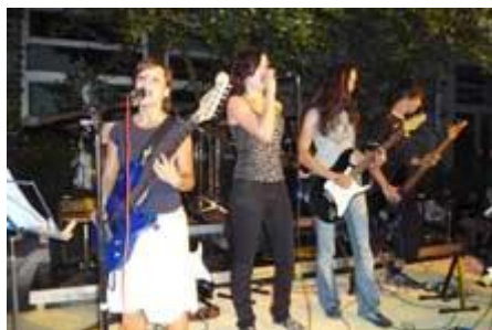
Hand nehmen und ordentlich rocken.