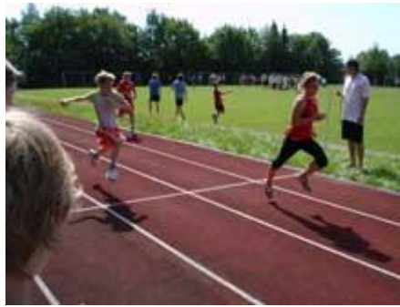
was das Zeug hält.