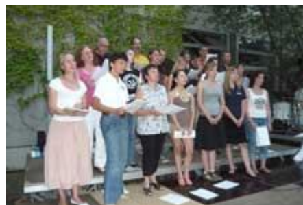
gleich auch noch den Schüler-/Lehrerchor, ...