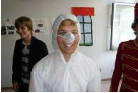
Und wenn sie nicht gestorben sind, ...