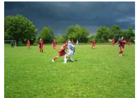
Gewitterwolken nur am Himmel

Abends: Der Elternbeirat des Gymnasiums Wertingen hat die ARGE-Eltern zu einer Sitzung an unsere Schule eingeladen. Die Damen und Herren sind beeindruckt!