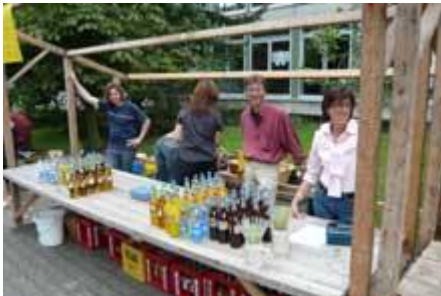
nur dass es kein Bier gibt.