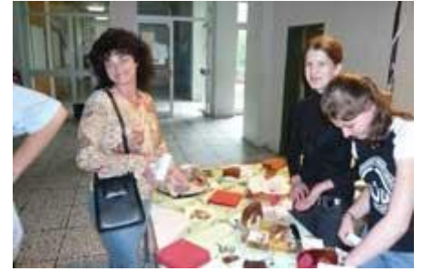
... und echte Kuchen.