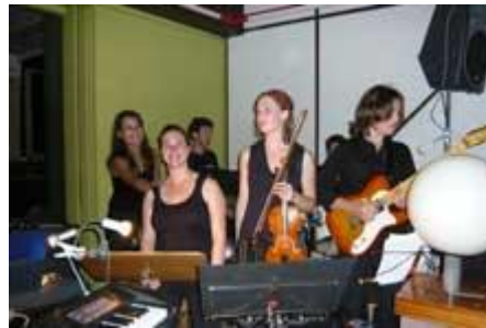
Die Band mit Schülern ...