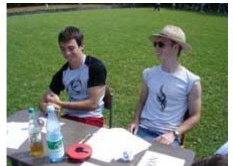
und Auswerten. Naja!