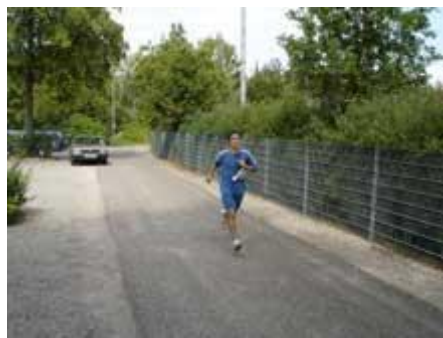
und abschließend Laufen.