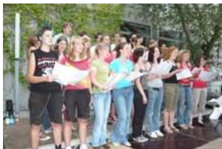
Die 10d präsentiert Elton John ...