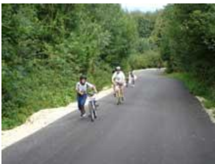
(FAHREN war ausgemacht!)