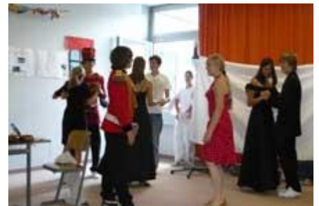
begleitet es dann auf den Ball, ...